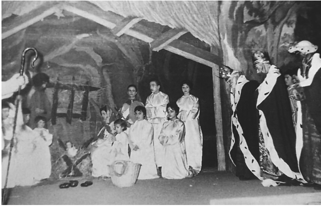
El primer Nadal dels pastors a la Catequística. Montserrat és la primera a la dreta després dels tres Reis.

Les sardanes li encantaven sempre que es ballessin molt acuradament, i formà part de la Colla sardanista Figueres que Pere Puntí coordinava i amb la qual participà en molts concursos.