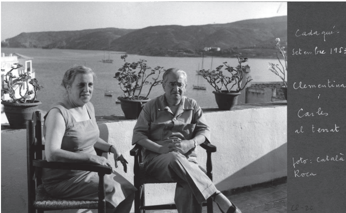
Cadaqués, setembre de 1953