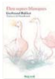
DEU OQUES BLANQUES GERBRAND BAKKER RAIG VERD TRADUCCIÓ DE MARIAROSICH 230 PÀG./17,95 €

El llibre, però, té un gran final alliberador, que no vol dir feliç. Posa en joc, igual que l'anterior, personatges que es retiren voluntàriament del món i s'instal·len als marges, com qui s'asseu una estona a la riba d'un riu per veure'l fluir. A més de la dona i el noi, mereixen una menció el marit i un detectiu que fan un viatge del tot peculiar a la recerca de la dona, o d'alguna altra cosa. I la proposta literària és volgudament radical i delicada, cosa que s'agraeix en un context dominat per una escriptura mastegada i reiterativa. No agrada a tothom, però en farà feliços uns quants. ♦♦