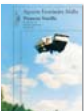
Proyecto Nocilla A. FERNÁNDEZ-MALLO Alfaguara

Amb la novel·la Nocilla experience (2006), Agustín Fernández-Malloy va aconseguir un petit fenomen indie que va continuar creixent amb les dues novel·les següents de la trilogia, on abunden el collage narratiu, la vocació experimental i la utilització de recursos més habituals en poesia. Alfaguara reuneix els tres llibres en un sol volum, una bona porta d'entrada a l'univers creatiu de l'autor, que el 2012 va publicar el poemari Antibiótico .